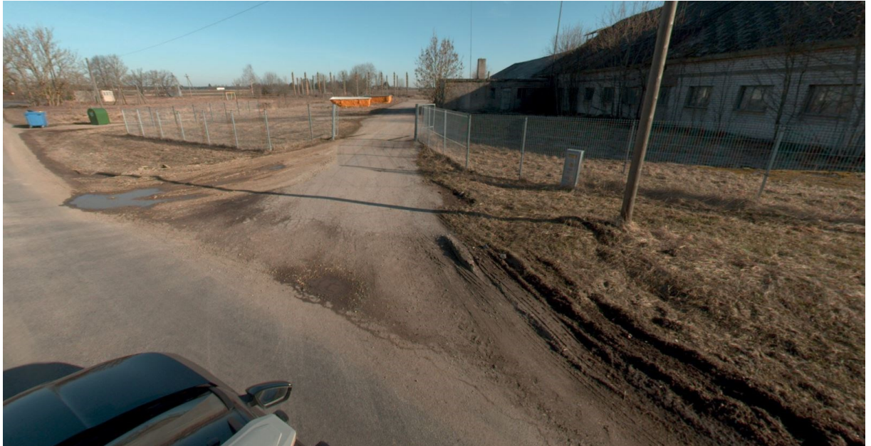
Joonis 1. Riigitee nr 11345 km 1,133 ristumiskoha seisukord, aprill 2023